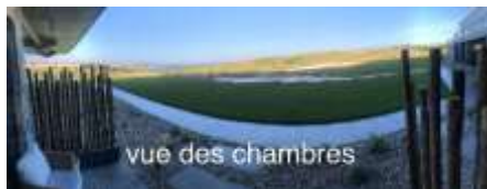
vue des chambres